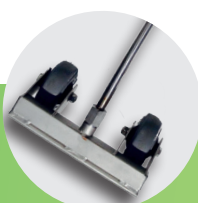
Ugresslanse m/hjul 30 cm