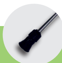
Rengjøringslanse for høyt trykk