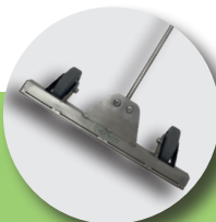
NYHET! Patentert Broad Flow ugresslanse 45 cm