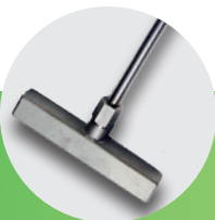
Ugresslanse 20 cm